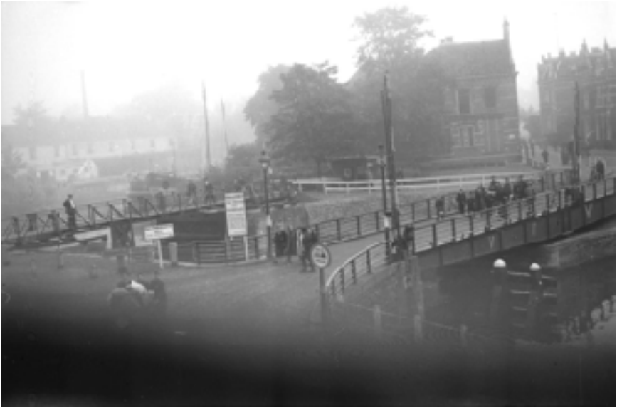
beeld: Joodse Zwollenaren lopen hun dood tegemoet

Naast de rol closetpapier had mijn vader in het ouderlijk huis een haak voor de handdoek geschroefd. Zo leek het. Trok je die haak echter naar voren dan werd in de grote muurkast in de slaapkamer de vloer ontgrendeld. Loze wandruimten waren er veel in de 'Haagse Tussenbouw'. Onder de muurkast een even zo grote ruimte. Daar kon je met een trapje afdalen en naar de Engelse zender luisteren.